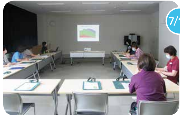
鳥取ファミリーサポート